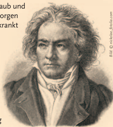
Ludwig van Beethoven.

Wenn Sie wissen wollen, wie man ein Leben mit Jesus Christus beginnt, nennen wir Ihnen: